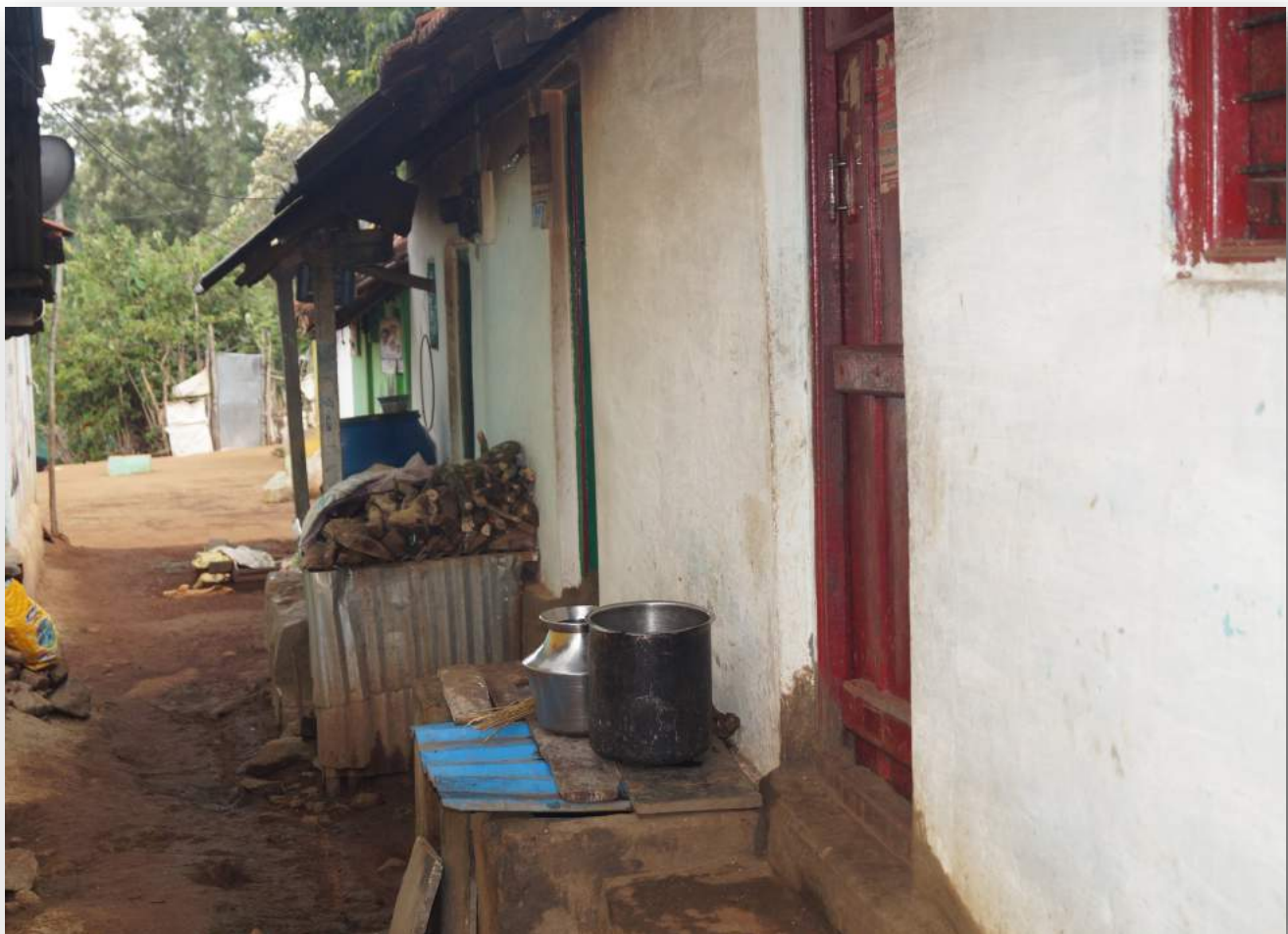
Paraipatti Village main street