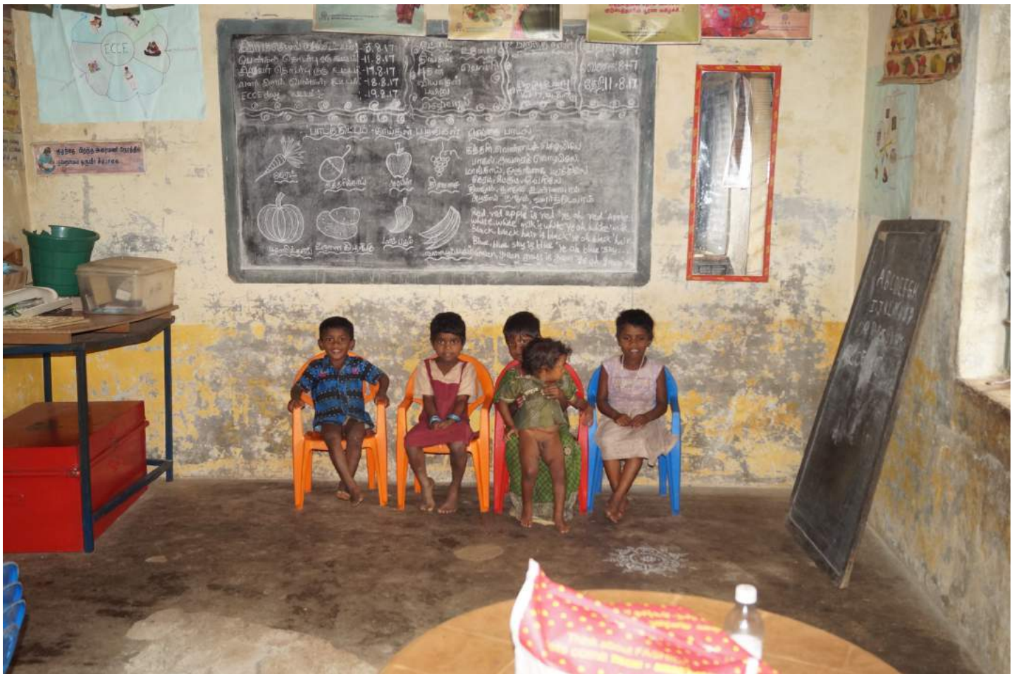
Children inside Balwadi (kindergarten). There about 13 kids in the kindergarten. Some of them are staying outside but attend Balwadi for playing or running around the village.