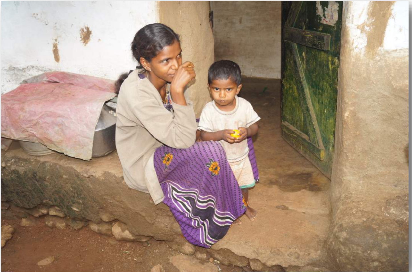
Mother with Baby. The baby enjoys sweets and biscuits and both are looking at our staff who is standing in front of them.